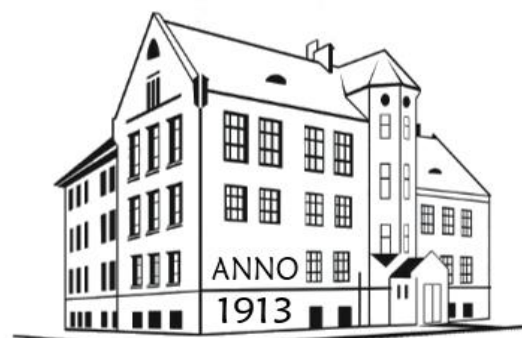
Rīgas Reinholda Šmēlinga vidusskola